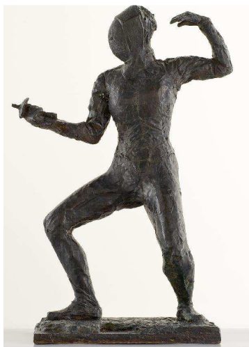
G. Richier, L'escrimeuse , 1943, ©Montpellier Agglomération