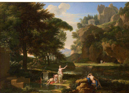
F.X. Fabre, La Mort de Narcisse , 1814, ©Montpellier Agglomération

Les billets peuvent être achetés à l'avance à la billetterie du musée ou le jour même dans la limite des places encore disponibles.